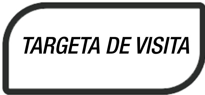
Targeta de visita genèrica color