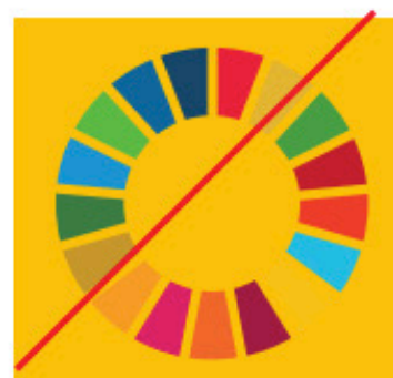
Col·locar la roda de colors a caixa de colors