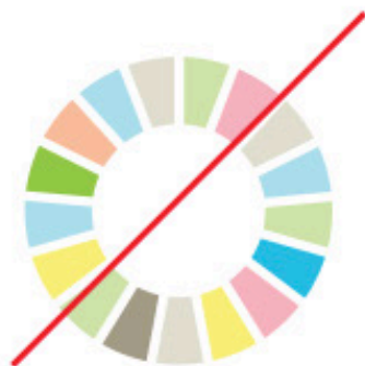
Alterar els colors