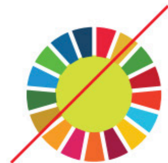
Col·locar un color a mig de la roda de colors SDG