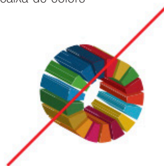
Extruir o bisellar